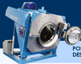
POSIÇÃO DE DESCARGA