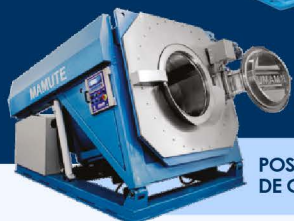
POSIÇÃO DE CARGA